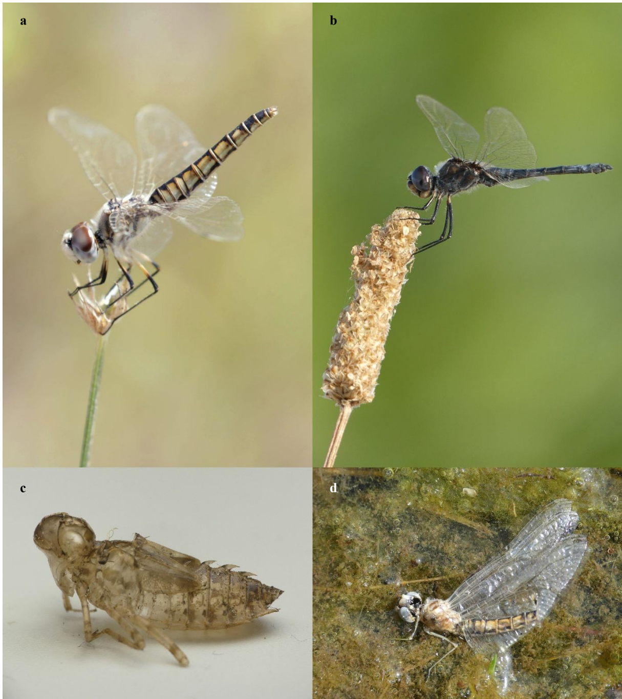
Fig. 3. a) Femelle mature, site EDF 1, 11/06/25, crédit photo : Jérémie Hahn. b) Mâle mature, plan d'eau de l'île du Passerou, 19/06/25, crédit photo : Camille Le Merrer-Le Bot. c) Exuvie récoltée sur le site EDF 2 et mise en collection chez le 1 er auteur, 12/06/25, crédit photo : Camille Le Merrer-Le Bot. d) Femelle ténérale morte, site EDF 2, mise en collection chez le 1 er auteur, 12/06/25, crédit photo : Camille Le Merrer-Le Bot.