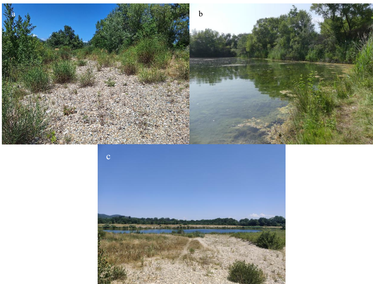
Fig. 2. Sites ayant fait l'objet d'observations de S. nigra . a) EDF 1. Habitat d'observation des imagos, 11/06/25. b) EDF 2. Plan d'eau de découverte des exuvies (exuvies trouvées sur la berge au premier plan). 12/06/25. c) Plan d'eau de l'île du Passerou. Habitat d'observation des imagos. 19/06/25.