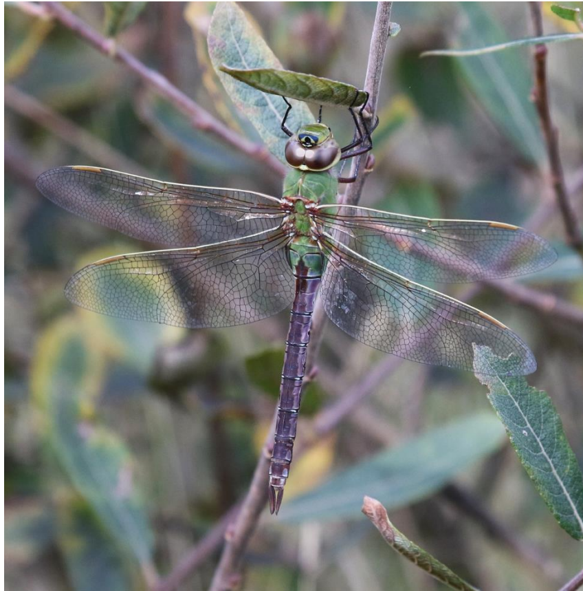
Fig. 2 - Femelle d' Anax junius posée dans le marais du Kun à Ouessant, le 22 octobre 2023.