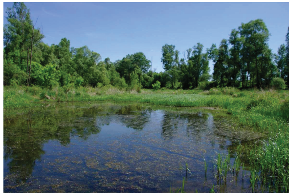
Figure 1. Site de Fonds Fenouillet, zone de la première observation, sur la commune de Feurs

Suite à cette découverte, d'autres sites jugés favorables à l'espèce ont été prospectés. Ces recherches ont été fructueuses puisque deux ♂♂ d' H. ephippiger ont été observés les 29 et 30 mai sur le site du Garollet (Fig. 2a) (commune de Saint-Laurent-la-Conche), toujours sur l'Écozone du Forez. Là encore, il s'agit d'une ancienne gravière réhabilitée. L'espèce a été observée dans une zone de cariçaies à Laïche faux-souchet ( Carex pseudocyperus L.) et d'une scirpaie marécageuse à Scirpe des marais ( Eleocharis palustris (L.) Roemer & Schultes). La plupart des mares du site sont temporaires. D'une profondeur d'environ 20 à 30 cm, elles s'assèchent progressivement au cours de l'été.