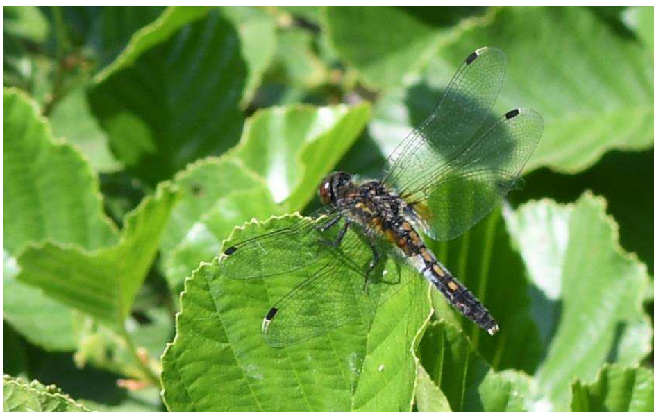
Figure 1. Leucorrhinia caudalis ♀ observée le 21/05/18 sur la commune de Thouaré-sur-Loire. Leucorrhinia caudalis observed for the 1 st time in the Loire-Atlantique department.