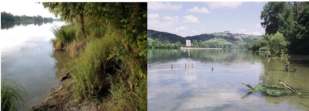
Figure 2. L'habitat larvaire de Gomphus flavipes , (a) la Saône à Peyzieu (01), (b) le site de Plaine de Gerbay sur le Rhône (38)

Ce secteur de l'île de la Platière présente un fonctionnement particulier du fait de sa situation en entrée de lône et par suite de son surcreusement et de son élargissement qui sont intervenus au début des années 1980 dans le cadre d'un projet halieutique. Il se comporte depuis ces travaux comme un « piège à sable ». Le suivi disponible depuis 1988 (PONT et al. 2004) documente bien cette accumulation progressive de sable et la dynamique de ces alluvions dont la localisation et le profil sont modifiés à chaque crue. Cette lône abrite dans ses parties à courant nul ou faible d'importants herbiers aquatiques à Vallisneria spiralis , Najas marina , Ceratophyllum demersum et, depuis quelques années, Elodea nuttallii . Son peuplement odonatologique est bien connu (PONT et al. 2004) avec comme espèces dominantes : C. s. splendens , E. lindenii , E. viridulum , P. pennipes , I. elegans , G. vulgatissimus , O. f. forcipatus , O. cancellatum et Anax imperator . On y observe plus localement Coenagrion puella (Linnaeus, 1758), Boyeria irene (Fonscolombe, 1838), Libellula fulva O.F. Müller, 1764, L. depressa , Orthetrum coerulescens (Fabricius, 1798), Crocothemis erythraea (Brullé, 1832) et Sympetrum striolatum . En 2009, la reproduction d' Oxygastra curtisii a été découverte sur cette lône.