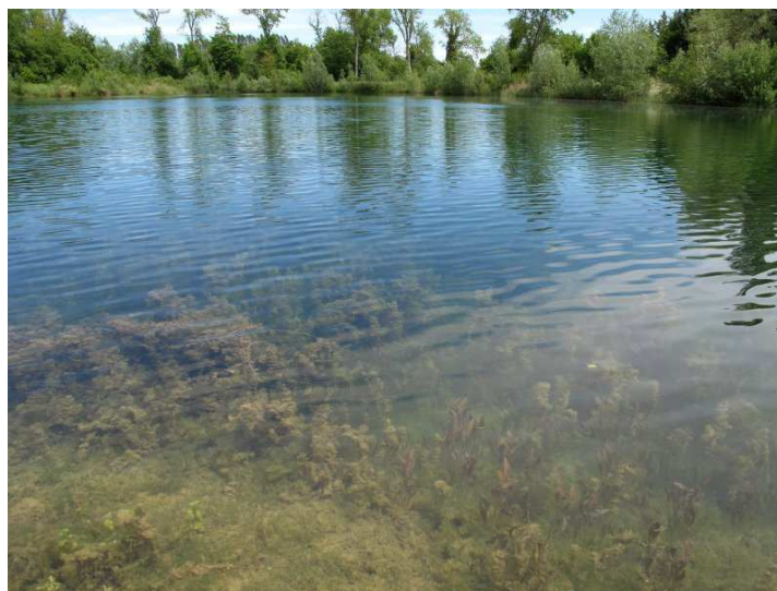
Figure 2. Gravière favorable à Leucorrhinia caudalis dans le secteur d'Arc-sur-Tille.