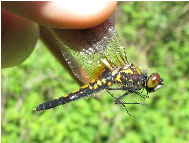
Figure 1. Premier individu (♀) de Leucorrhinia caudalis observé en Côte d'Or le 13 mai 2012 (espèce protégée au niveau national nécessitant une autorisation de capture) (© G. Doucet).