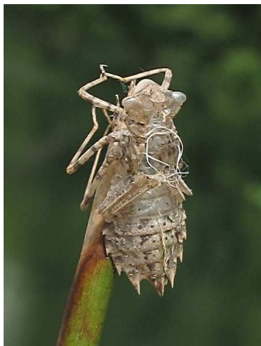
Figure 3 : Première preuve d'autochtonie de Leucorrhinia caudalis en Côte d'Or (13 mai 2012).