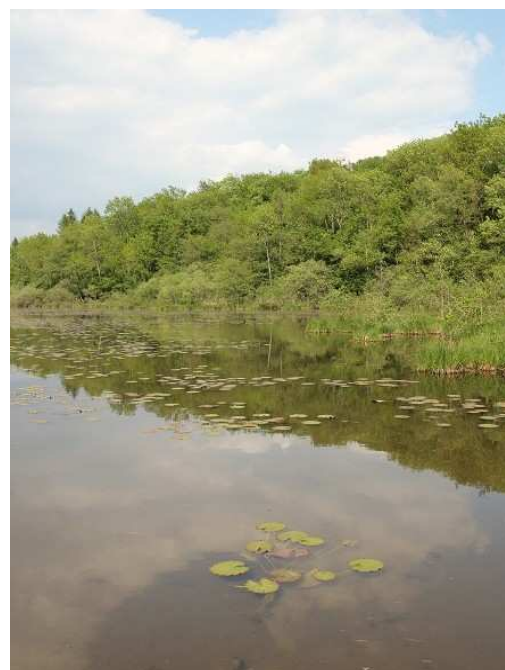
Fig. 4 : Étang du Châtillonnais, 2 e station d'observation de L. caudalis en Côte d'Or.