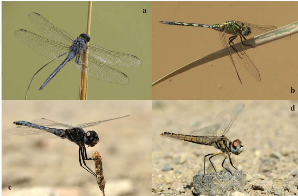
Figure 1. Deux espèces ayant établi récemment des populations en Corse : Orthetrum trinacria (a) ♂ et (b) ♀ et Selysiothemis nigra (c) ♂ et (d) ♀. Two Odonata having recently settled breeding populations in Corsica.

Selysiothemis nigra a été observé la première fois en Corse en 2015 (SANNIER, 2015). Les populations de cette espèce érémitique connue du centre et du sud-ouest de l'Asie au Moyen-Orient et au bassin méditerranéen occidental (KALKMAN & BOGDANOVIC, 2015) sont en phase de densification rapide en Méditerranée (BOUDOT & DE KNIJF, 2012 ; BROCHARD C. & VAN DER PLOEG, 2013 ; UBONI et al. , 2015 ; KALKMAN & BOGDANOVIC, 2015). Cette espèce au corps noirâtre chez le mâle à maturité et généralement plus clair chez la femelle possède une tête de taille assez importante par rapport à son corps (DIJKSTRA & LEWINGTON, 2007). En Corse, sans observation attentive des individus, un risque de confusion avec Sympetrum fonscolombii (SELYS, 1840) est possible. On pourra cependant aisément distinguer S. nigra par l'absence de tache orangée à la base des ailes postérieures. Cette libellule peut se développer dans une grande variété de milieux d'eau stagnante, généralement de petites tailles, peu profonds et parfois temporaires ou semi-temporaires (DIJKSTRA & LEWINGTON, 2007 ; UBONI et al. , 2015). La nervation alaire de cette espèce, blanchâtre, lâche, très fine et à peine discernable en conditions naturelles sur le terrain, permet par ailleurs de la différencier de Diplacodes lefebvrei (RAMBUR, 1842), récemment arrivé en Sardaigne et qui pourrait arriver en Corse dans le futur, chez qui la nervation est très noire et bien visible.